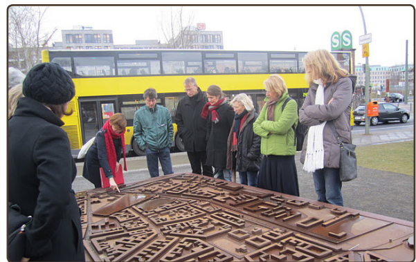
Am 2. Dezember besuchte die Gruppe die Gedenkstätte Berliner Mauer an der Bernauer Strasse.